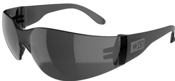
WeldOps SE-100 čirá, šedá